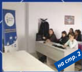
на стр. 2