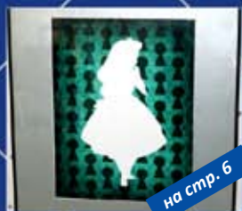
на стр. 6