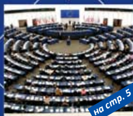
на стр. 5