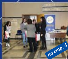
на стр. 4