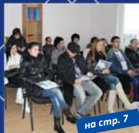
на стр. 7